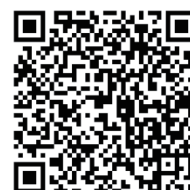
参加申込用 QRコード